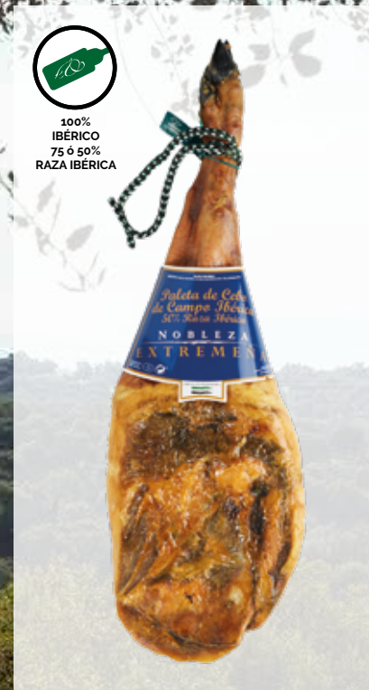
PALETA de CEBO de CAMPO 100% IBÉRICA y PALETA de CEBO de CAMPO IBÉRICA 75% RAZA IBÉRICA y 50% RAZA IBÉRICA Raza Ibérica: 100% 75% 50% Cód. artículo: 53231 53232 54206 Piezas caja: 3 Cajas pallet: 24 Consumir pref.: 270 días Conservación: Fresco y seco