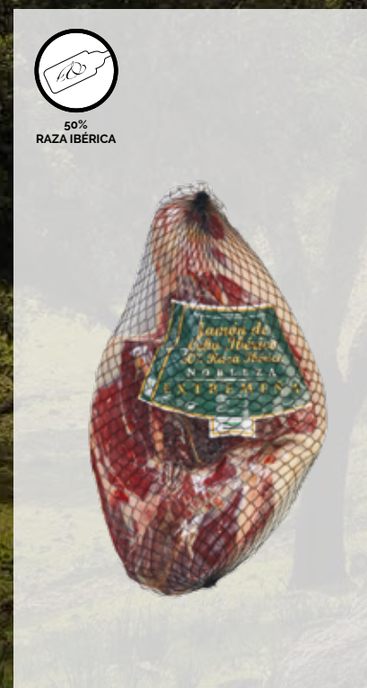
JAMÓN de CEBO IBÉRICO, 50% RAZA IBÉRICA DESHUESADO Cód. artículo 50% Raza Ibérica: 54106 Piezas caja: 2 Cajas pallet: 36 Consumir pref.: 180 días Conservación: Refrigerado