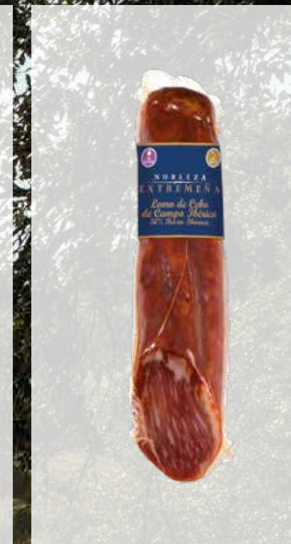
LOMO de CEBO de CAMPO IBÉRICO, 50% RAZA IBÉRICA MEDIOS Cód. artículo 50% Raza Ibérica: 50125 Piezas caja: 9 Cajas pallet: 72 Consumir pref.: 120 días Conservación: Fresco y seco