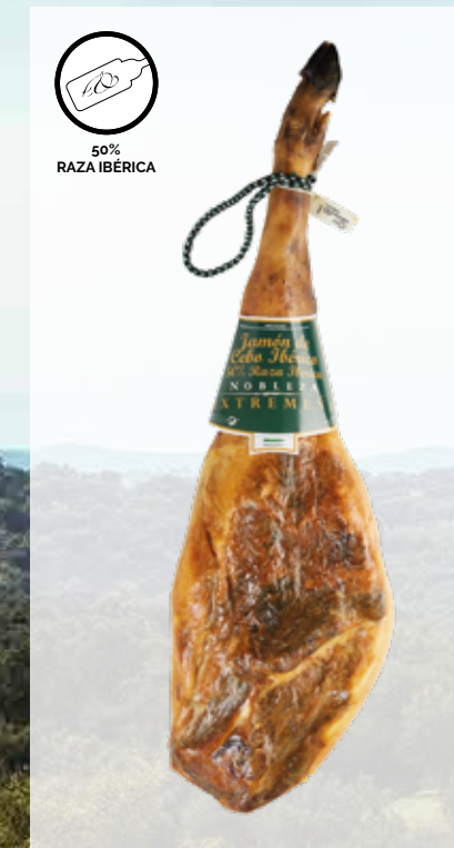
JAMÓN de CEBO IBÉRICO, 50% RAZA IBÉRICA Cód. artículo 50% Raza Ibérica: 54104 Piezas caja: 2 Cajas pallet: 24 Consumir pref.: 270 días Conservación: Fresco y seco