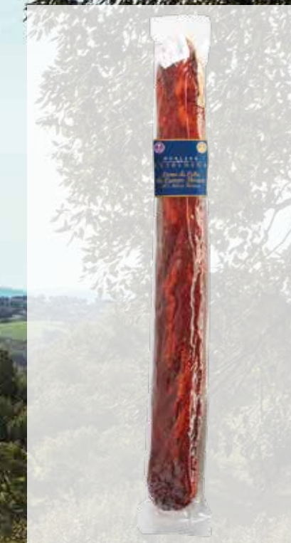
LOMO de CEBO de CAMPO IBÉRICO, 50% RAZA IBÉRICA Cód. artículo 50% Raza Ibérica: 50124 Piezas caja: 4 Cajas pallet: 72 Consumir pref.: 180 días Conservación: Fresco y seco