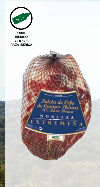
PALETA de CEBO de CAMPO 100% IBÉRICA y PALETA de CEBO de CAMPO IBÉRICA 75% RAZA IBÉRICA y 50% RAZA IBÉRICA DESHUESADA Raza Ibérica: 100% 75% 50% Cód. artículo: 53233 53234 54207 Piezas caja: 4 Cajas pallet: 50 Consumir pref.: 180 días Conservación: Refrigerado