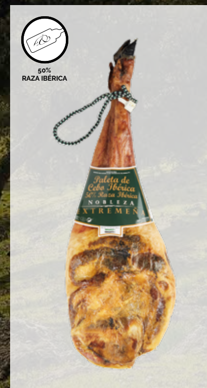
PALETA de CEBO IBÉRICA, 50% RAZA IBÉRICA Cód. artículo 50% Raza Ibérica: 54204 Piezas caja: 3 Cajas pallet: 24 Consumir pref.: 270 días Conservación: Fresco y seco