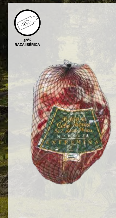
PALETA de CEBO IBÉRICA, 50% RAZA IBÉRICA DESHUESADA Cód. artículo 50% Raza Ibérica: 54205 Piezas caja: 4 Cajas pallet: 50 Consumir pref.: 180 días Conservación: Refrigerado